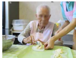
シートの上に盛る