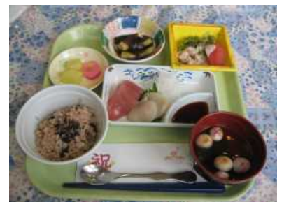
9月16日（水） 敬老祝い膳 刺身盛り合わせ 赤飯、煮物等