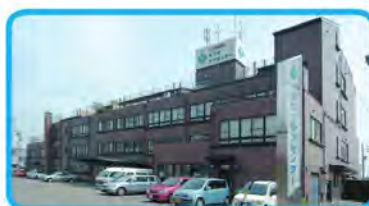
介護老人保健施設サワダケアセンター