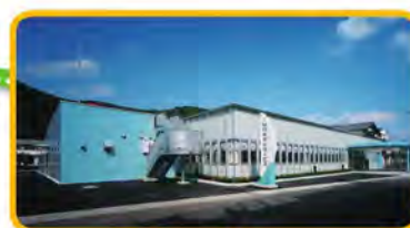
サワダデイサービスセンター