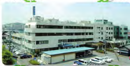
医療法人社団 慈朋会 澤田病院