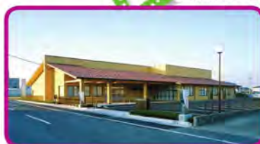
サワダデイサービスセンターぎなん

訪問看護ステーション サワダ 居宅介護支援事業所 ほっとステーション サワダ 居宅介護支援事業所 サワダケアプランセンターぎなん